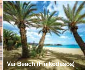
Vai Beach (Finikodasos)